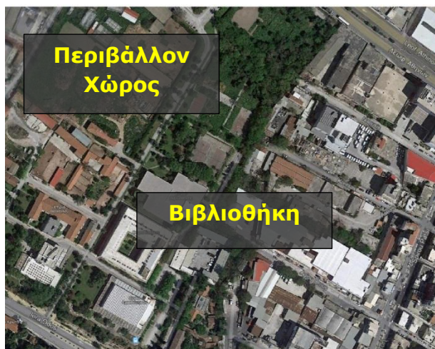
Εικόνα 1: Περιοχή Παρέμβασης

Η περιοχή υλοποίησης των παρεμβάσεων παρουσιάζεται στην παρακάτω εικόνα με επισήμανση των παραπάνω χώρων.